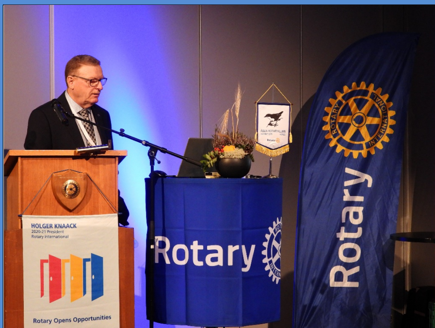
Et flott og tydelig Rotary-podium – guvernøren åpner Distriktskonferansen 2020

Distriktskonferansene er muligheten vi Rotarianere har for å treffes, få nye venner, inspirasjon og påfyll. Årets konferanse gikk på Stjørdal 18.-20.september 2020. Totalt 57 personer var innom gjennom helgen, og vi fikk høre gode foredrag om humlene, aquakultur og Rotary som fredaaktør. Fire ungdommer representerte Rotarys ungdomsprogrammer ved å fortelle om sine opphold i utlandet.