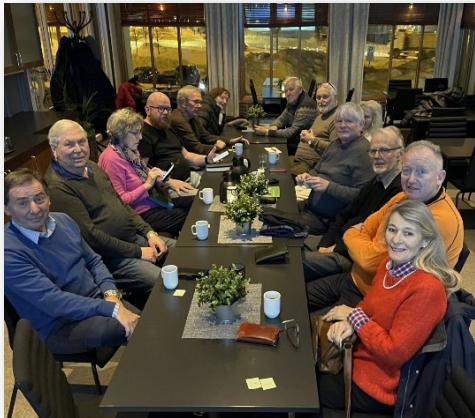
Lydhøre medlemmer fra Bodø Rotaryklubb

Når det gjelder prosjekt er det litt å gå på, men små nyttige prosjekt kommer med jevne mellomrom.