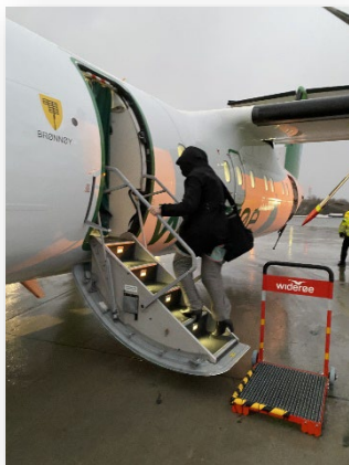
Et ærlig forsøk på å komme seg til Mo i Rana, men storm værgudene hadde en annen formening om det.

Mandag 13.januar var det planlagt Guvernørbesøk i Mo i Rana Rotaryklubb. Da fikk værgudene overtaket og det var ikke mulig å komme seg dit. Vi vet hvor vi bor, så det kan skje.