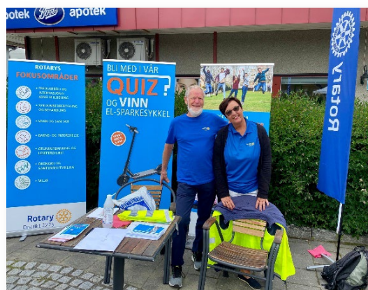
Rotary-Quiz i Meldal

Med stand midt i de travleste gatene, kjøpesentrene eller på et godt synlig sted fikk mange mennesker kontakt med Rotary. Noen for første gang, - og noen som ville ha mer informasjon om Rotary.