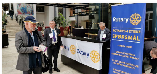
Innsjekking til PETS – Scandic Rica Hell

Å treffe andre, dele erfaringer og synspunkter, er viktig. Inspirasjon og påfyll er en drivkraft i arbeidet for Rotary.