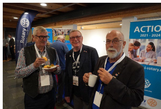
Fra ACTION-Gruppens stand – Distriktskonferansen 2021

Takk til AG'ene som bidro til å sette dette viktige tema på dagsorden.